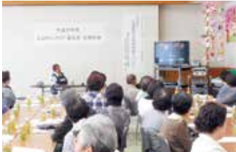
定期総会後の特別講演

が毎年参加しています。この日は、決算報告や予算案の審議の後に特別講演を行っています。今