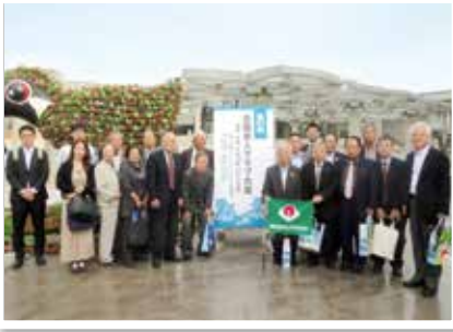
和歌山県からの参加者

第一日は、午後から次の四つの活動交流部会が開催されました。 ・第一部会「私たちの地域を支え合おうー新地域支援事業への参画」 ・第二部会「仲間を増やそうー会員増強運動の推進」 ・第三部会「老人クラブ高齢消費者被害防止キャンペーン」 ・第四部会「演じる活動」(全国から参加した六団体が舞台発表) 全国から約千五百名が参加するなか、県内からの参加者十九名も、それぞれの部会に分かれて参加しました。