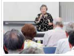
岩出市老連西川女性副部長

会員増強活動の取り組みとして、会員加入増強促進研修会を、紀北地域が九月二十日(木)に和歌山ビッグ愛にて参加者三十名で、紀南地域が九月二十七日(木)に田辺市の紀南文化会館にて参加者三十二名で開催しました。