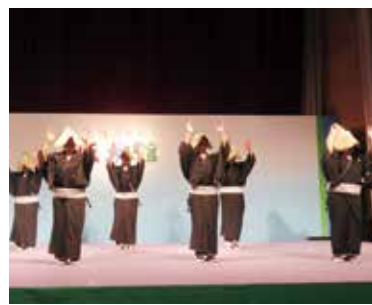
郷土芸能のステージ

ステージでは、富山にゆかりのあるチンドン屋を皮切りに、コーラス、玉すだれ、フラダンスといった多彩な出し物が演じられ、中でもこきりこ節やおわら風の盆といった富山県の民謡、伝統芸能は大変見応えのあるものでした。