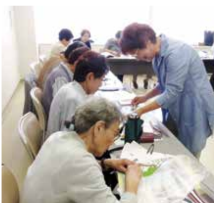
記念品製作講習会の様子

ときめき八十四号でもお伝えしたように、現在、県老連では円滑な開催に向けて実行委員会、企画検討委員会で検討を重ねており、女性部会では、来場者記念品の製作も行われています。