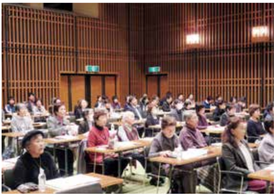
熱心に研修する参加者

最後は、恒例となっている参加者全員での「ふるさと」の合唱により、会を締めくくりました。