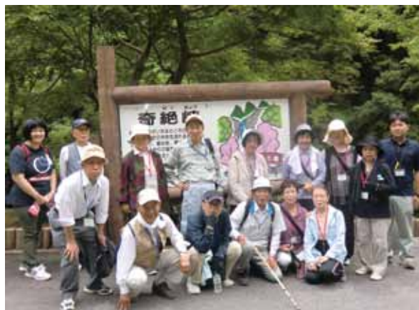
健康ウォーキング

（茶粥）会」を開催しているクラブ等々、それぞれが工夫を凝らして独自の活動を行っています。老人クラブは年齢も幅広く、体力もそれぞれ個人差がある方々が集まっていますので、全員に満足してもらえぬ事業を実施するのは容易ではありませんが、「お互いさま」と支え合い、いたわり合う友愛の気持ちを持って、それぞれの活動を頑張っていきたいと思えます。